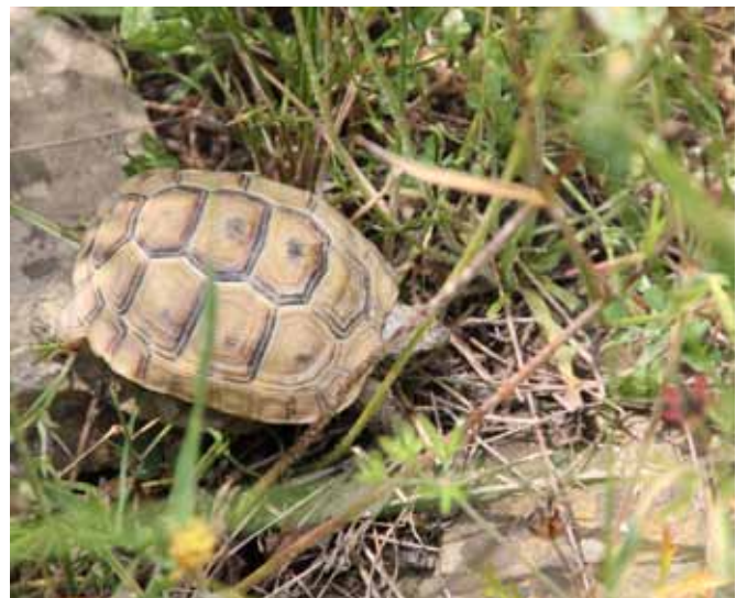
Abb. 18 a–d

Auf dem Kap Emine fanden wir eine mit Zecken befallene T. g. ibera (a, b) unter demselben Strauch mit einer T. h. boettgeri (c), an der keine Zecken zu finden waren, gleiches beobachteten wir bei den Schlüpflingen von T. g. ibera (d, sehr hell pigmentiert, was für Schlüpflinge aus der Region allgemein gelten soll) im selben Areal.